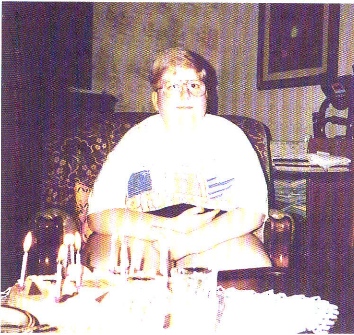
[Fig. 10] Un jeune atteint du PWS avant l'époque de l'hormone de croissance.

Avec l'âge, les enfants multiplient les contacts, ce qui pose de nouveaux problèmes: les voisins, les amis au jardin d'enfants et à l'école, les professeurs et les proches doivent être mis au courant que, si les parents restreignent la nourriture de leur enfant, ce n'est pas par méchanceté, mais par nécessité. Il est très important d'informer les autres personnes à ce sujet. En grandissant, les enfants peuvent aussi comprendre par eux-mêmes pourquoi ils doivent faire attention à leur alimentation. Toute-