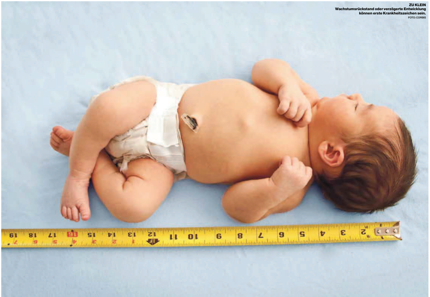
ZU KLEIN Wachstumsrückstand oder verzögerte Entwicklung können erste Krankheitszeichen sein.