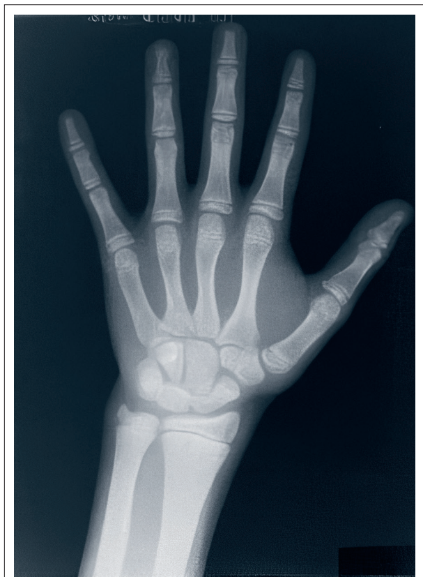
Abb. 2: Handröntgenbild der linken Hand