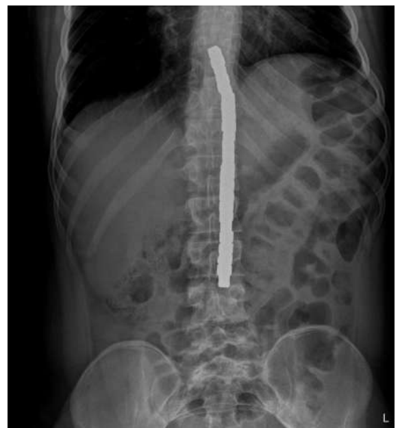
Abbildung 1: Konventionell-radiologisch zeigte sich ein ca. 22 cm langer und 1,4 cm breiter, röntgendichter Fremdkörper. Dass die Magnete sich im Magen und im Zökum befanden, war hier noch nicht bekannt.

Zur weiteren Diagnostik führten wir eine konventionelle Abdomenübersichtsaufnahme durch (Abb. 1). In dieser zeigte sich überraschend ein ca. 22 cm langer und 1,4 cm breiter, röntgendichter Fremdkörper vertikal auf das Abdomen projiziert, mit einer Ausdehnung von Höhe Brustwirbelkörper 11 bis Lendenwirbelkörper 4. Es fand sich keine freie Luft, ein Zeichen, dass keine Perforation vorlag. Auch unter Vorweisen des radiologischen Befundes bekannte der Patient erst nach mehrmaligem Nachfragen, 24 Stück Magnete im Verlauf des Nachmittages beim Aufhängen eines Bildes verschluckt zu haben.