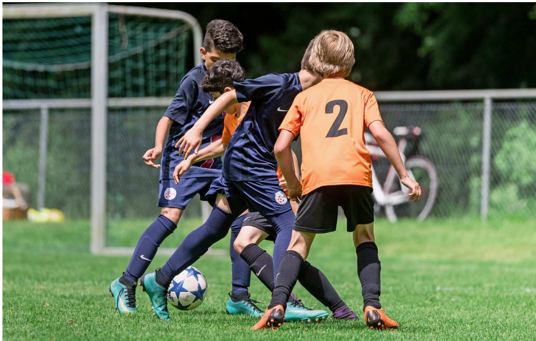
Wie erkennt man begabte Fussballer? Junioren in Aktion.